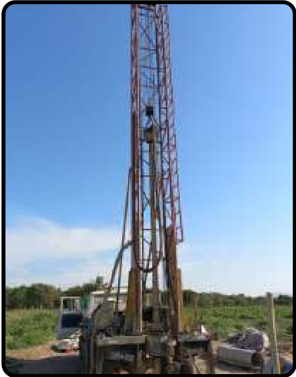
Perforación de pozo tubular.