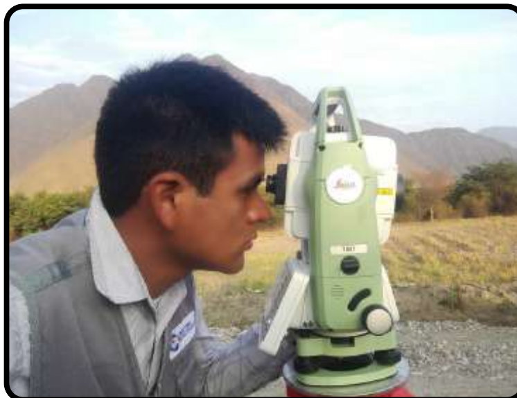
Trazo de dique de protección en rio chicama.