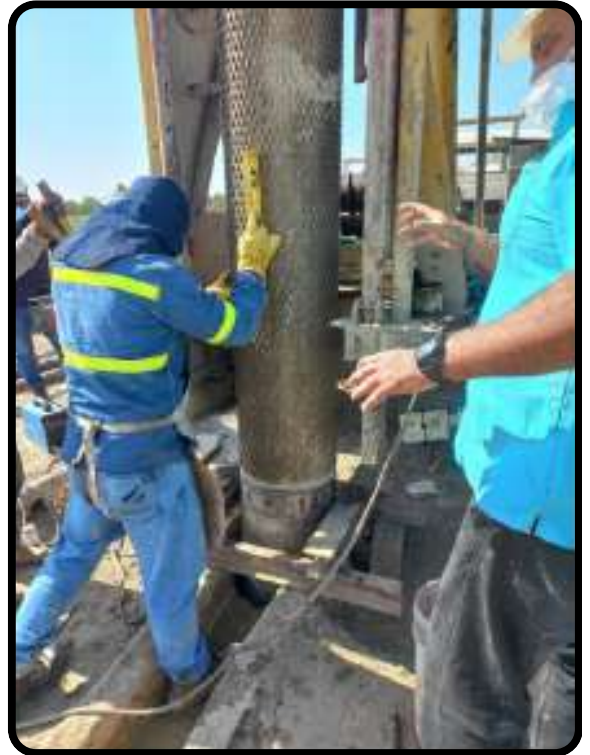
Verificación de verticalidad de tubo de pozo.