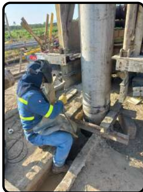
Entubado de pozo tubular.