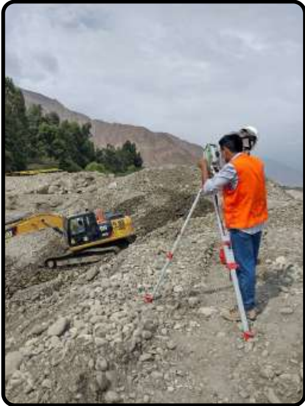
Control de excavación en caisson de puente colgante jaguey