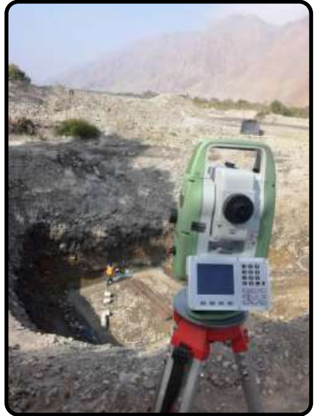
Control de excavación en caisson de puente colgante jaguey.